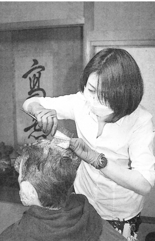
自宅の和室でカラーリング＝武蔵野市

介護の知識は必要条件となりつつある。独自の資格を設けている団体の一つ、一般社団法人日本美容福祉学会(渋谷区)は、04年から「美容福祉師」の資格基準を作り、4種類の資格を認定している。15年3月末現在、社会福祉士の資格を持つ上級に12人、介護福祉士の1級287人、ホームヘルパーの2級443人、講習会を修了した6648人と、計7390人が認定された。